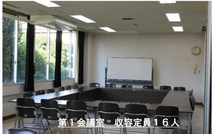
第1会議室 収容定員16人